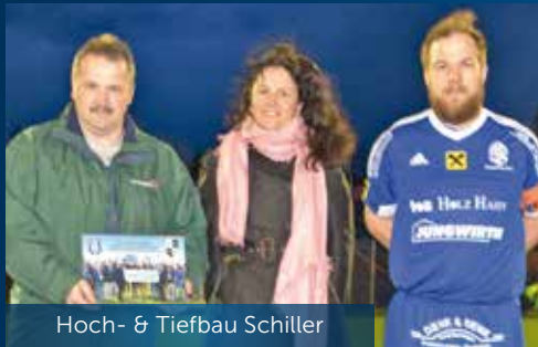
Hoch- & Tiefbau Schiller