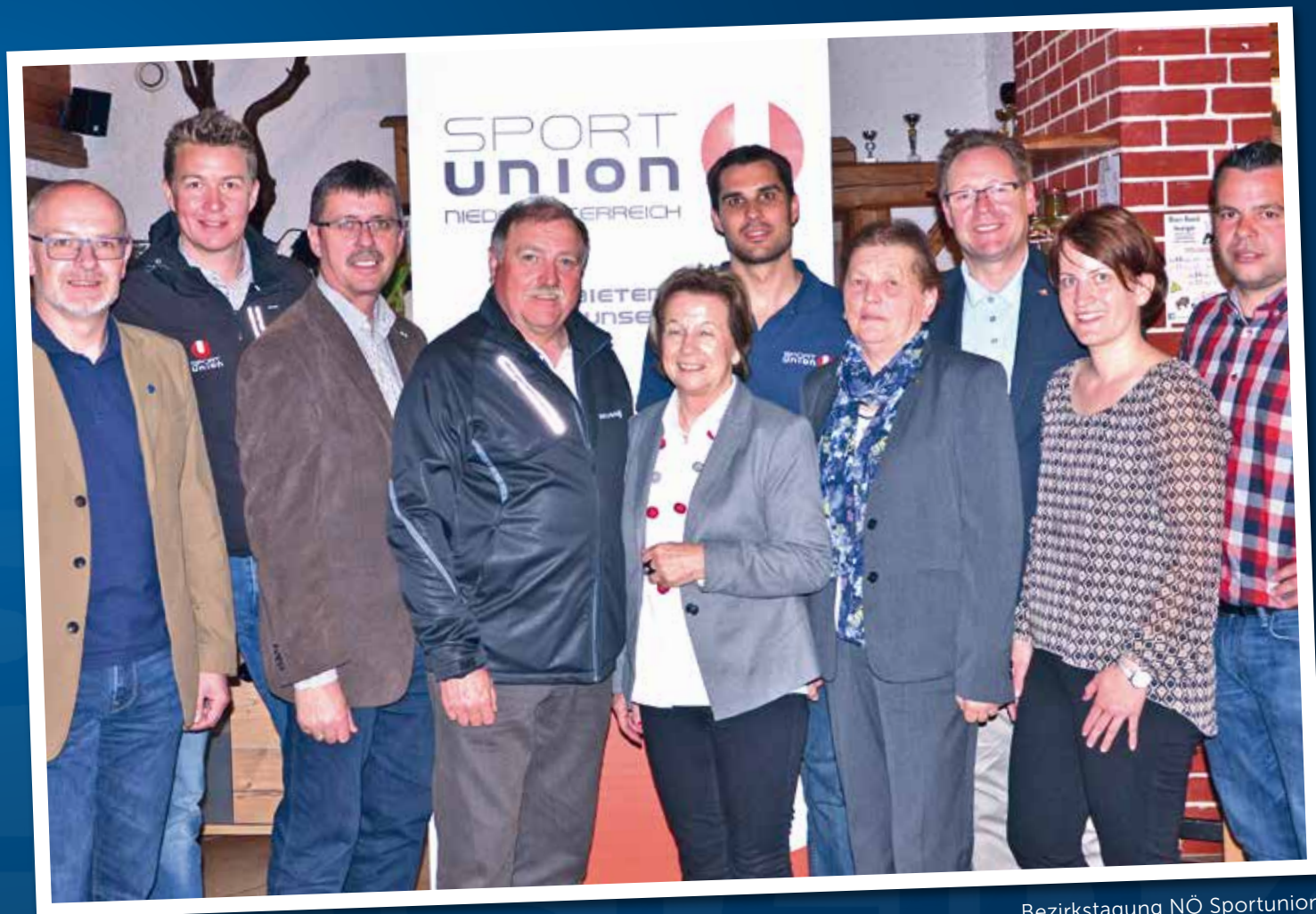
Bezirkstagung NÖ Sportunion