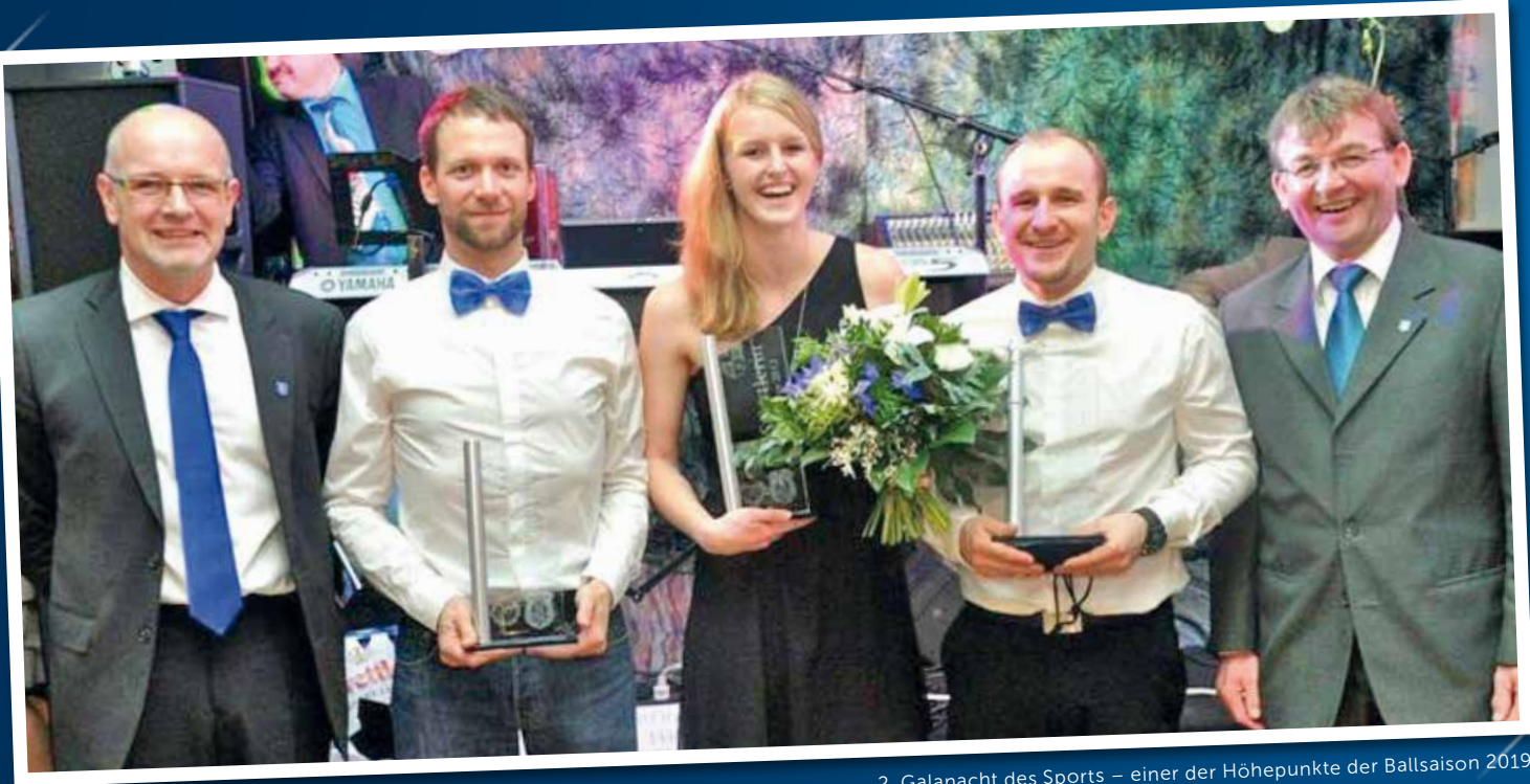
2. Galanacht des Sports – einer der Höhepunkte der Ballsaison 2019

U nglaublich, wie schnell fünf Jahre vergehen – 2019 ist es wieder soweit, wir feiern anlässlich 35 Jahre USC Rappottenstein die „ 2. Galanacht des Sports “ im Fasching 2019. Genaue