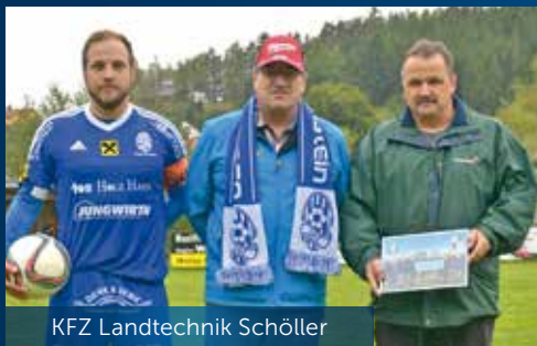
KFZ Landtechnik Schöller