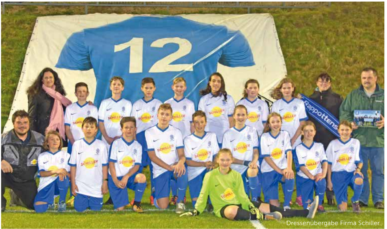
Dressenübergabe Firma Schiller