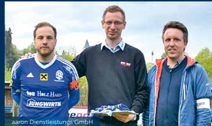
aaron Dienstleistungs GmbH