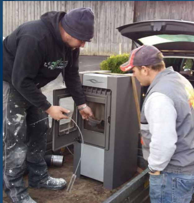
ANSCHAFFUNG DES NEUEN PELLETOFEN FÜR DIE KANTINE