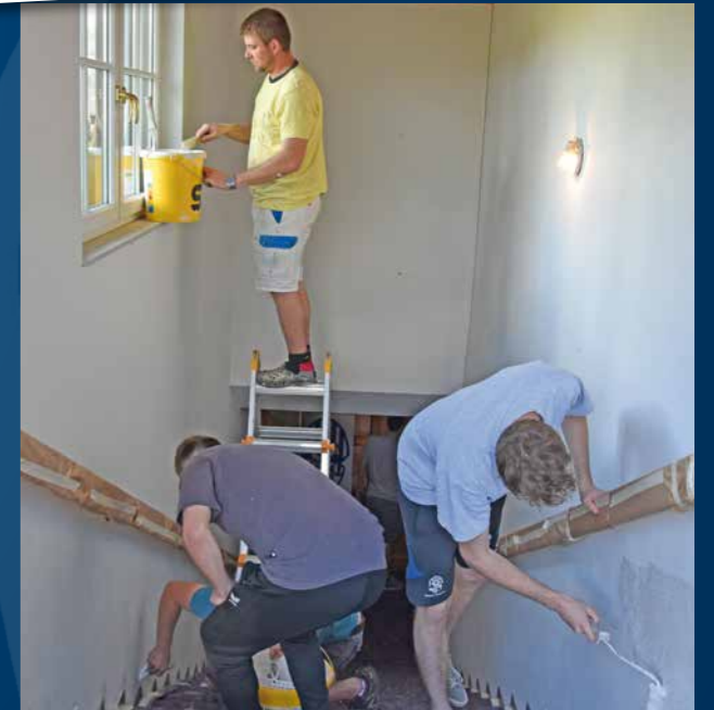
AUSMALEN DES KABINENGEBAUDES