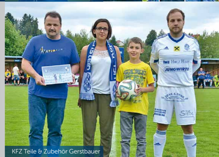
KFZ Teile & Zubehör Gerstbauer