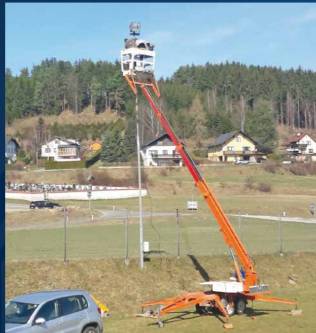
ERWEITERUNG DER FLUTLICHTANLAGE AM TRAININGSPLATZ