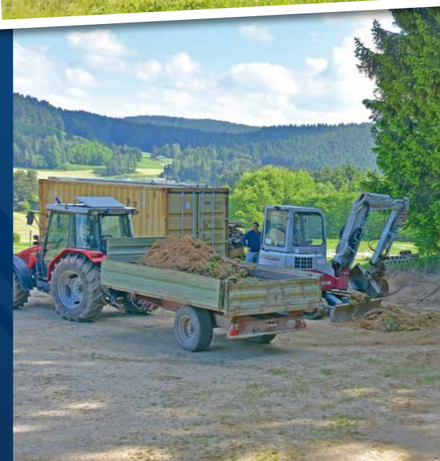
BEGRADIGUNG DES FESTPLATZES